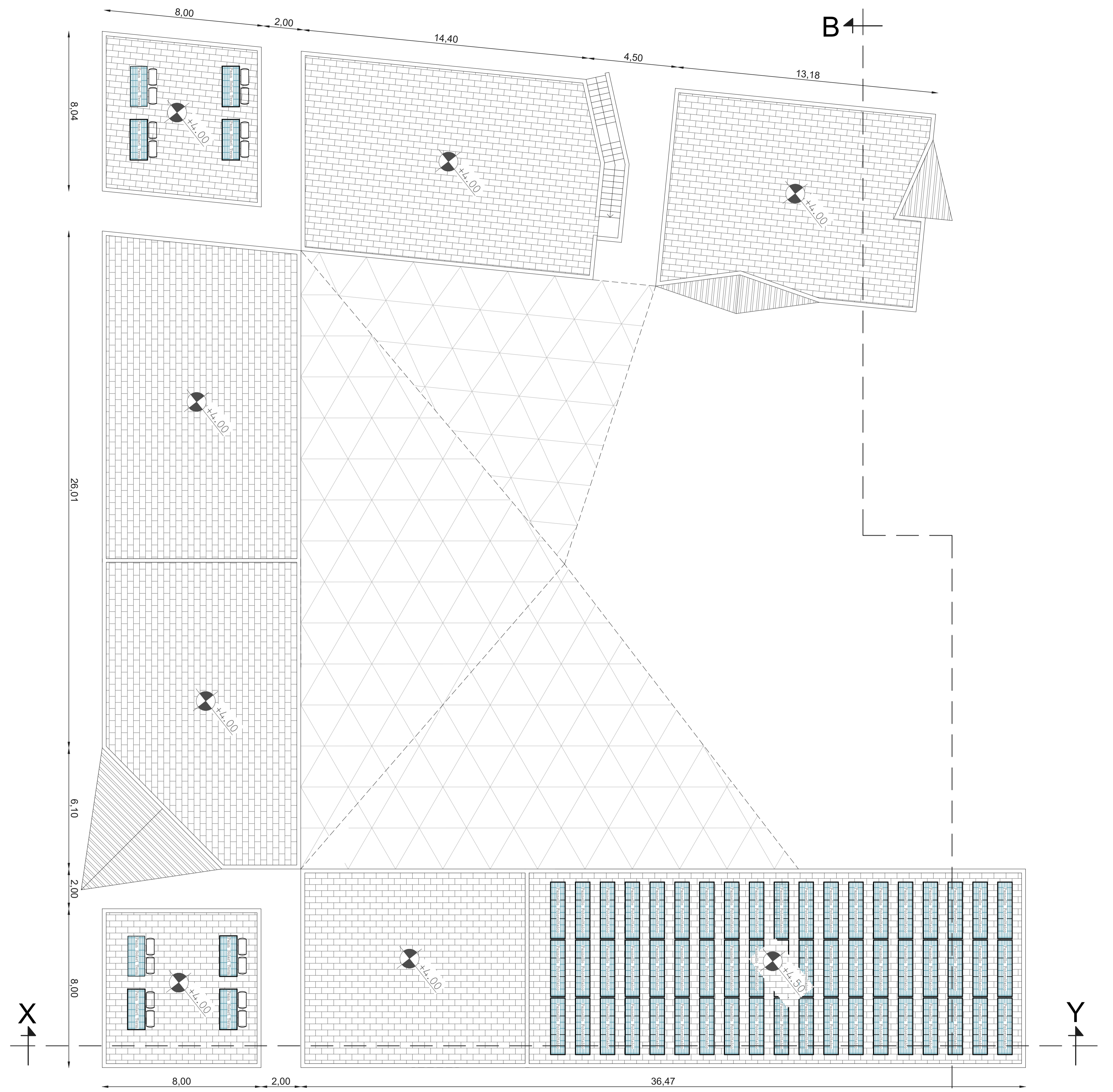
PIANTA PIANO COPERTURE - scala 1:100